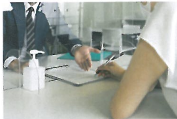
パーティション越しの対話